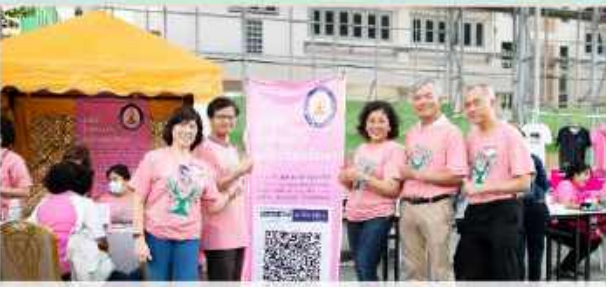
ชุมนุมนักเรียนเก่า เตรียมอุดมศึกษา ที่มณฑล ศิริรีวัฒน์ ต.อ.38 และที่ทุกภูมิภาคให้เกียรติ มาต้อนรับกันถึงหน้าชุมนุม