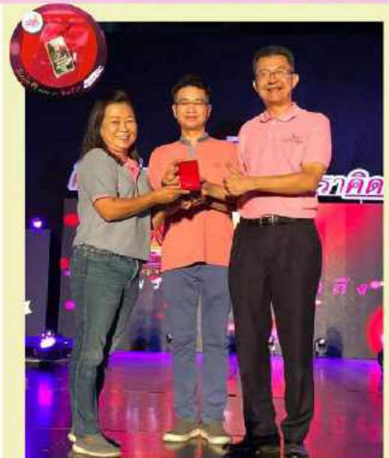
รางวัล lucky draw ในงาน 82 ปี เตรียมอุดมศึกษา "คืนสู่เหย้า...เพราะเราคิดถึง"

ทองแท่ง 1 บาท 1 รางวัล มูลค่า 23,000 บาท สนับสนุนรางวัลโดย เจริญ อิงคสารมณี 845/203 ต.อ.41