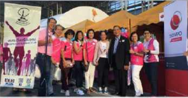
พิธีนะ รุ่งแสง ต.อ.11 ให้เกียรติมาและเยี่ยมชุมชนรวมถึงเตรียมอุดม