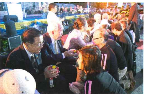
พิธีแสดงมุทิตาจิตอาจารย์อาวุโส