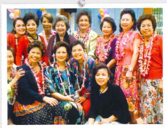
ตอ. 24 สังสรรค์งานปีใหม่ 24 ธันวาคม 2554 ที่โรงแรมมารวยการ์เดนส์

บรรยากาศการประชุมจัดงานคืนสู่เหย้า ครั้งที่ ๓๐ “ต.อ. ๗๕ ปี มีตำนาน” บน: เอกเรื่องจัดผังเวทีและการวางโต๊ะ ด้านไหน จะดีที่สุด ขวา: กรรมการตรวจรูปแบบสูจิบัตร ก่อนส่ง โรงพิมพ์ ซ้าย: ชุด นร. หญิงสมัยก่อน และโปสเตอร์งานคืนสู่เหย้า