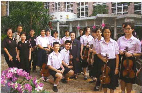
เตรียมตัวแสดงคอนเสิร์ตต้อนรับพี่ๆ ที่ศาลาพระเกี่ยวแก้ว