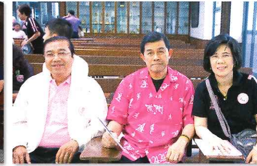
นักเรียนเก่าอาวุโสพบปะสังสรรค์คืนพี่-น้อง ณ ห้องเกียรติยศ