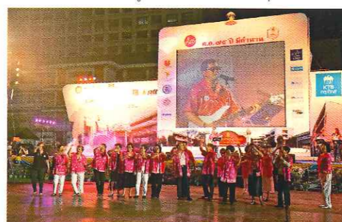
พี่กร ทัทพะรังสี เดียวก็ตำรพร้อมทางเครื่องรุ่น ๒๔