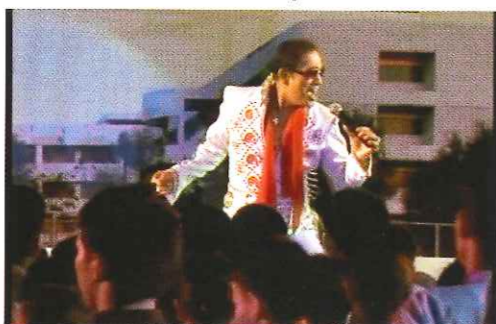
พี่อังกูร อาหารโรต (รุ่น ๒๓) วาดศิลปะสุดเหวี่ยง เอลวลียังอาย