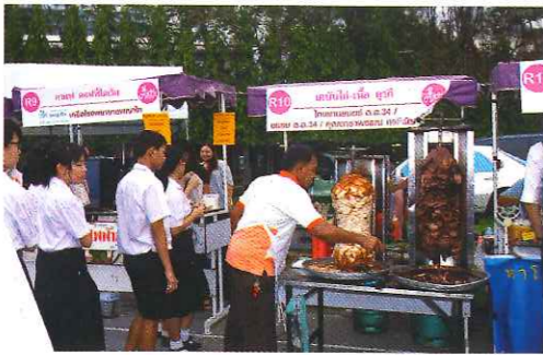
เคบับตุรกีขนานแท้ ของอร่อย ต้องคอยคิว