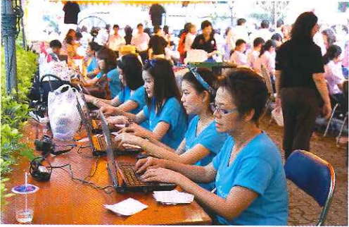
พнг. สาวสวยธนากรกรุงไทย ช่วยงานทะเลเวียนอย่างแข็งขัน