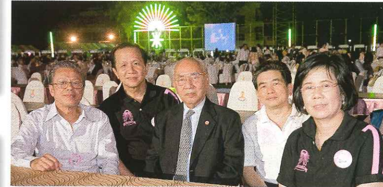
ฯพณฯ องคมนตรี พล.อ.อ.กำธน สินธวานนท์ ให้เกียรติมาร่วมงาน