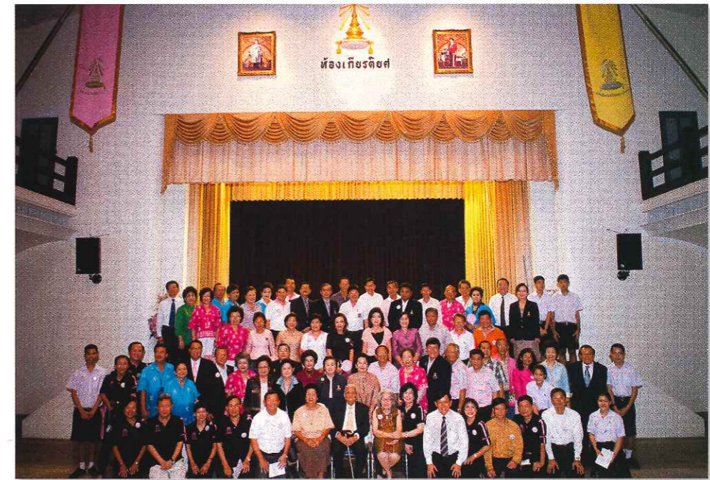
อาจารย์และนักเรียนเก่าอาวุโสถ่ายภาพร่วมกัน ณ ห้องเกียรติยศ ๑๑๑