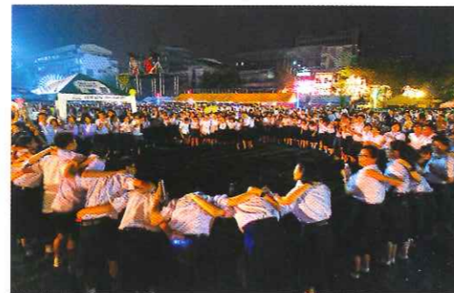
น้องๆ ล้อมวง บูมบัก้า กิกก้องสนามฟุตบอล