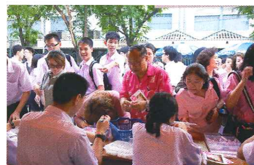
พี่ๆ น้องๆ มาลงทะเลเวียนกันล้นหลามเกินคาด