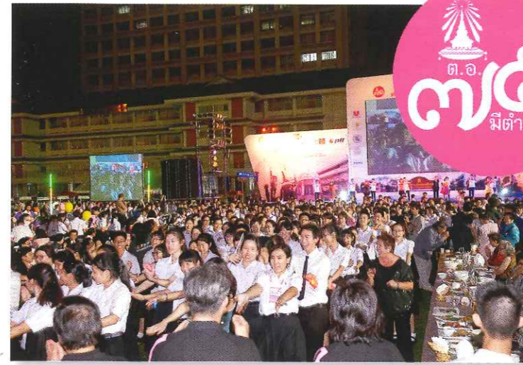
ทุกคนร่วมร้องและเต้น Macarena กันอย่างสนุกสนาน