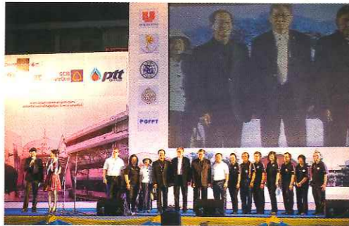
พิธีกรแนะนำคณะกรรมการจัดงานคืนสู่เหย้า “ต.อ. ๗๕ ปี มีตำนาน”