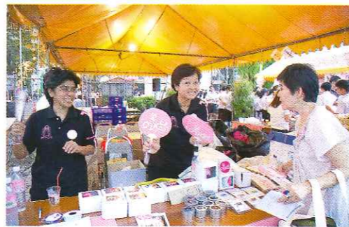
แม่ค้าจ๋า เหมาทังร้าน เท่าไหร่จ๊ะ