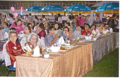
อาจารย์และรุ่นพี่ที่เกียรติมาร่วมงานคับคั่ง